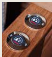
Badautomat autodose SASL1