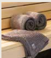
Harvia by Luhta -bastutextiler