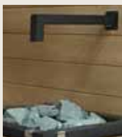
Designrör för badautomaten SASL2M