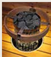
Skyddsräcke HPC3, skyddsräcke med LED-belysning HPC3L